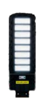
Lamparas solares públicas

Tus proyectos con energía solar a un click