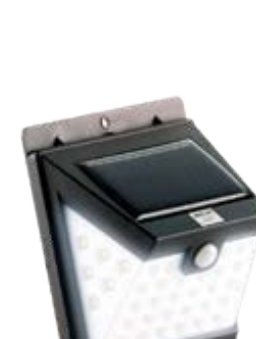
Aplicques de iluminación solar