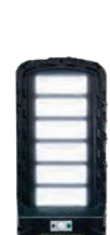
Alumbrado solar público